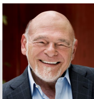
SAM ZELL ПРЕДСЕДАТЕЛЬ СОВЕТА ДИРЕКТОРОВ